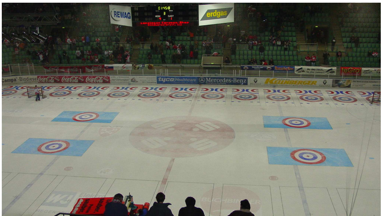
- farbige Zielfelder bei der EM in Regensburg -